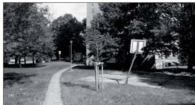
STÁVAJÍCÍ stav na sídlišti.